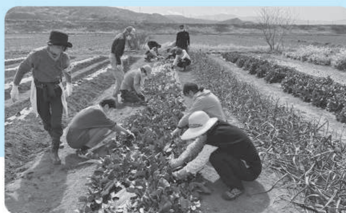
ときどきファーム