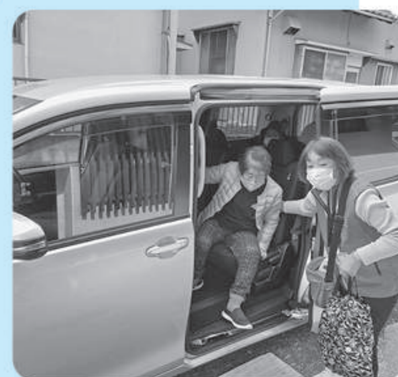
かなみおでかけサポート