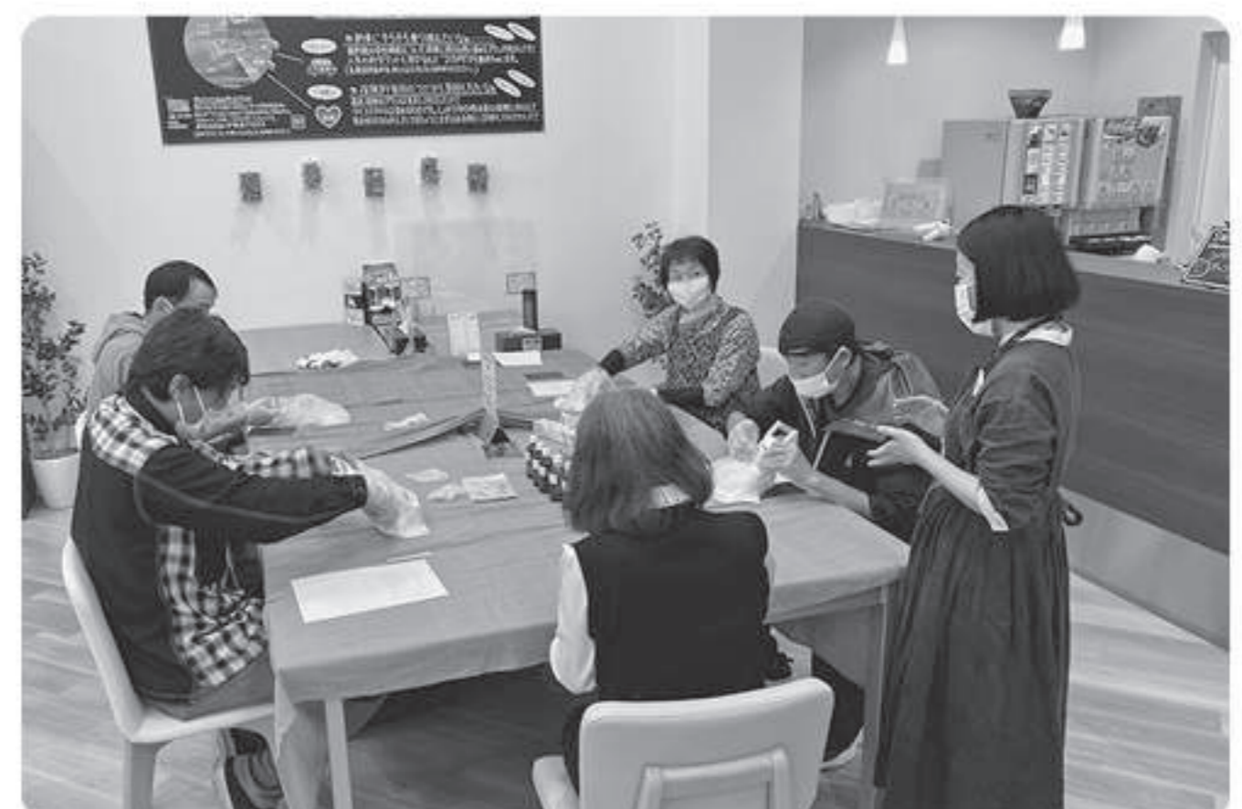
手作り石けんのワークショップ!!