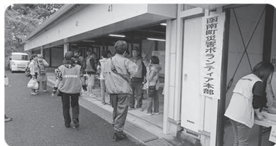
災害ボランティア