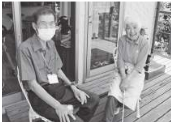
訪問時にはお話の花が咲くことも！